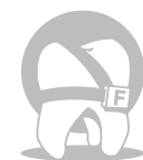
Отделяне на флуор

Дали ще изберете прах/течност или версията в капсули, GC Fuji VIII GP ще се смести във вашия бюджет. Не е необходимо ешване и многостъпкови свързващи агенти, което е сериозно предимство, когато пациентите са с ограничени доходи или правите много възстановявания.