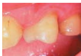
4. Окончателното възстановяване покрито с GC Fuji Varnish