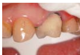
3. Поставен GC Fuji VIII GP цвят А3