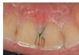
3. Препариран кавитет клас III