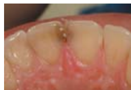
2. Същият случай преди лечение