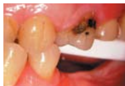
1. Кариес на кореновата повърхност на зъб 24