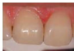
6. Окончателното възстановяване покрито с GC Fuji Varnish