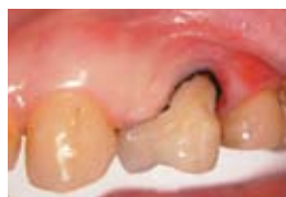
2. Завършената подготовка, поставен ретракционен конец