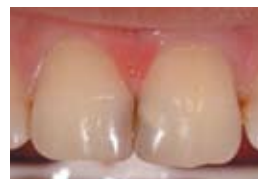
1. Кариозна лезия на зъби 11 и 21