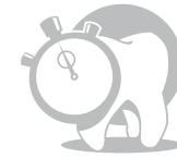
Лесен за употреба

Сила на свързване на GC Fuji VIII и различни само-втъврдяващи подсилени ГЙЦ използвани с кондиционер