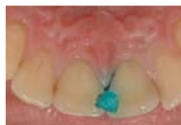
4. Кондициониране с GC Dentin Conditioner за 20 сек.