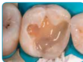
Applisering av everX Flow (Dentin farge)