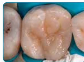
Siste lag Essentia (Universal farge)