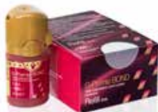
G-Premio BOND Universal bonding