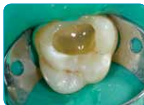
Applisering av everX Flow (Bulk farge)