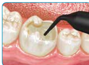
Remplir la cavité d'everX Flow