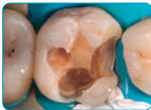
Préparation de la cavité