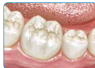
Résultat final après recouvrement par un composite conventionnel