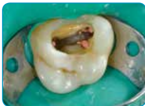
Préparation de la cavité