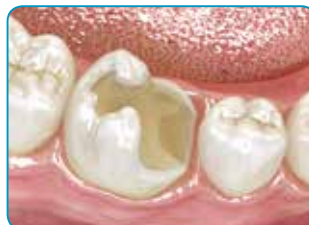
Préparer la cavité

Teinte Dentine pour des résultats plus esthétiques