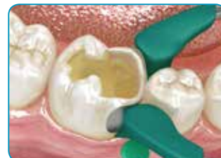
En cas de cavité de classe II, réaliser la paroi manquante avec un composite