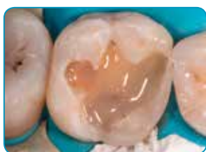
everX Flow aplitseerimine (Dentiini värvitoon)