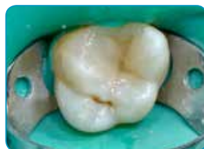
Viimane kiht G-aenial Universal Injectable iga (A3 värvitoon)