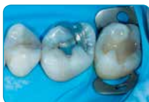
Autor Dr Javier Tapia Guadix, Hispaania

Tänu optimaalsele tiksotroopsusele kohandub everX Flow lihtsalt iga preparatsiooniga ja aitab vältida poorsuse teket .