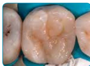
Viimane kiht Essentia (Universal värvitoon)