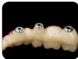
Lavoro realizzato dall'odontotecnico Christian Rothe, Germania