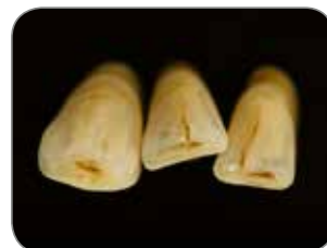
Lavoro realizzato dall'odontotecnico Jean François Deche, Francia