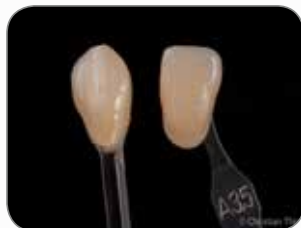
Lavoro realizzato dall'odontotecnico Christian Thie, Germania